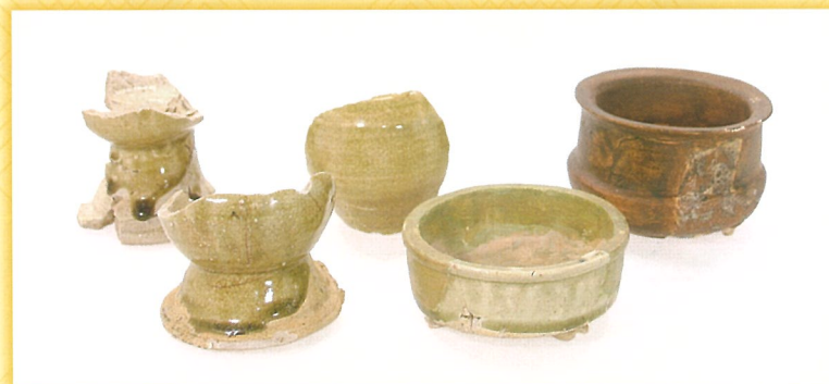
仏具 史跡北条氏邸跡（円成寺跡）出土