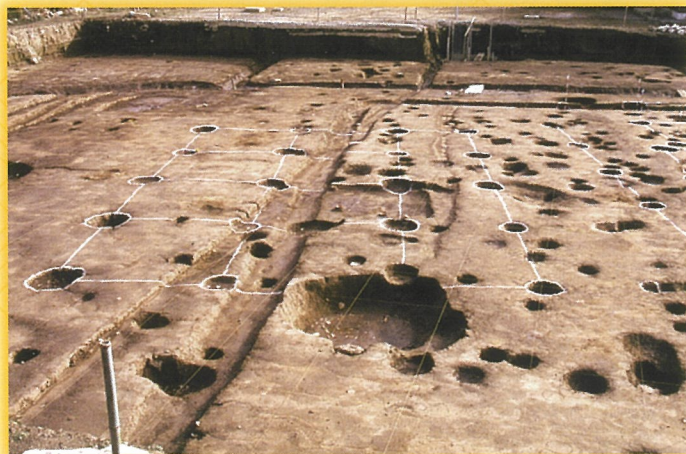
史跡北条氏邸跡（円成寺跡）の掘立柱建物の柱跡