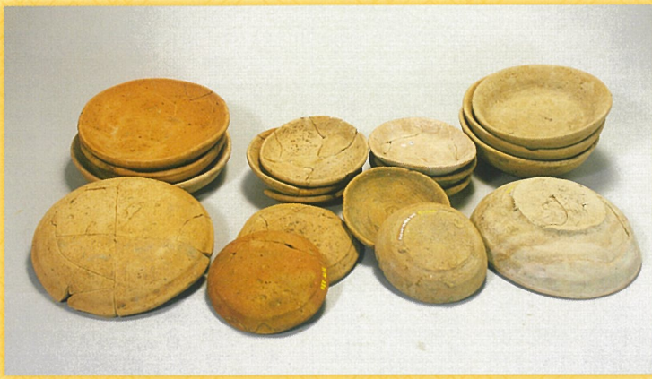
かわらけ 史跡北条氏邸跡（円成寺跡）出土