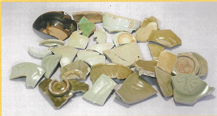
中国産陶磁器 青磁・白磁の破片 史跡北条氏邸跡（円成寺跡）出土