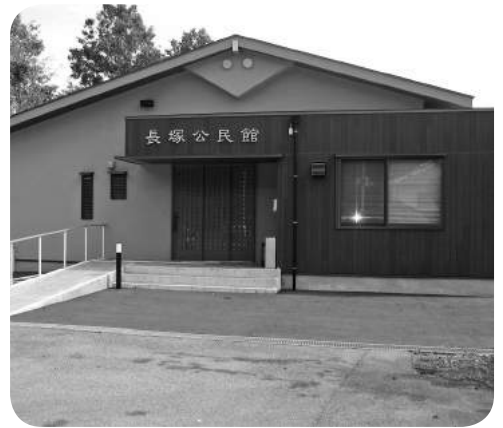
建て替えた長塚公民館

■ 自主公演事業のうちファミリーミュージカル白雪姫、林家正蔵・三平寄席の入場者数が少なかった理由は。