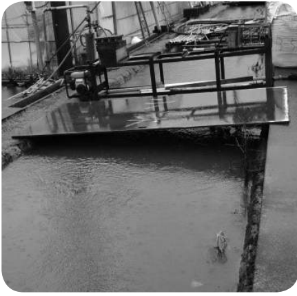
8月22日台風9号 洞川寺家地先