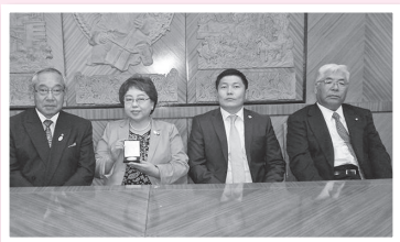
国会議員（右から2人目）と公式訪問団

ソングノハイラハン区とは、伊豆の国市と都市交流に関する覚書を昨年8月に締結しており、市長を団長とする公式訪問