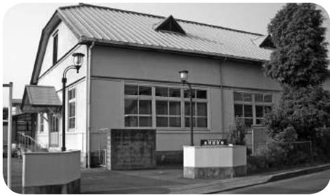
使用を休止した長岡図書館