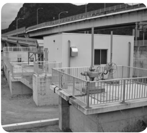
建設中の神島ポンプ場の一部

答 平成25年度の入札は、98件、総額17億7300万円、平成26年度は104件で、総額17億2200万円、平成27年度は112件で、総額22億9600万円となります。総額が多くなっているのは、葦山反射炉ガイダンス施設・神島ポンプ場・葦山小プール等の大型事業があったため。