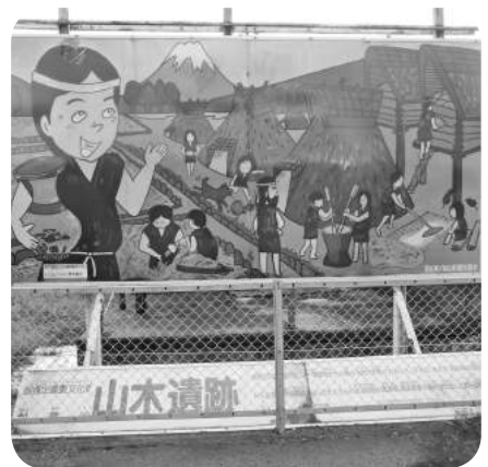
葦山いちご狩りセンター内の案内看板