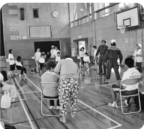
総合防災訓練の様子

答 炊事場やシャワールームが整備され、利便性も良いと考える。施設の倉庫に簡易トイレ・発電機・投光器・非常食等を配備。毛布・水・テントも備蓄している。