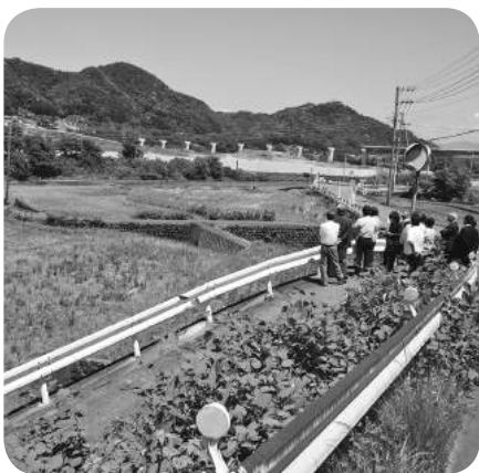
新ごみ処理施設建設地

答 建設費用76億円と推定、造成費等 は試算の段階。両市の負担割合は、均等 割50%、ごみ量割50%とする。現時点で ごみ量割の比率は未定。