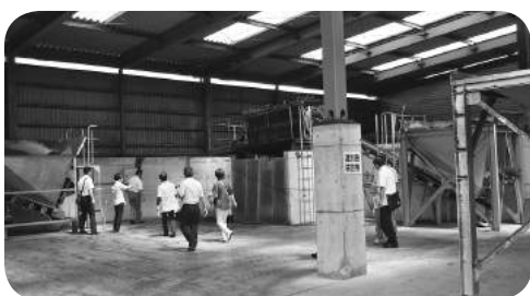
資源循環センター農土香現地調査