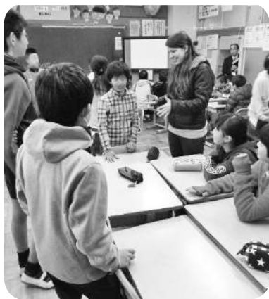
元気づく英語の授業(長岡北小)

答 課題は専門性と指導力向上で、ALTや専門教員の配置を考えていきたい。また、コミュニケーション能力の育成に努めたい。英語のOB教員の活用は費用面で難しい。文科科学省の英語特区については検討に値する。