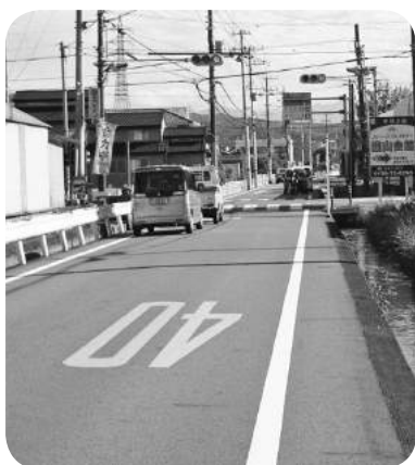
葦山中央農道(葦2-3号線)

市としては、事業採択に向け、担い手への農業集積を進めていくために、区域の確定作業を調整するなど働きかけをしている。