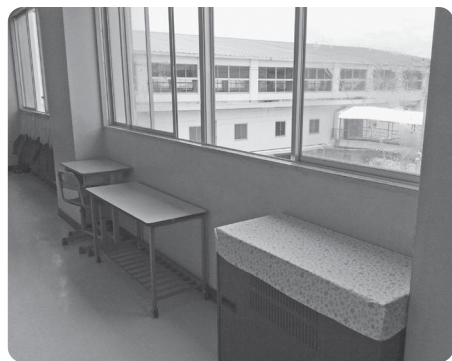
小学校の危険箇所・飛散防止フィルム

答 (1)けがで日本スポーツ振興会に保険申請をした件数は、小学校で738件、中学校では781件。けが等の種類は骨折や捻挫、打撲、頭部外傷など。