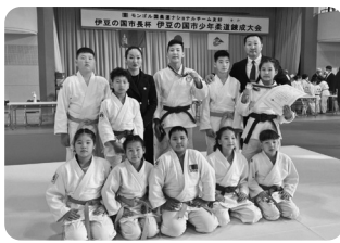
少年柔道錬成大会

答 ①8月6日から10日まで4泊5日、市長と議会側等9人でモンゴル国のソングノハイルハン区を公式訪問する。また、スポーツ庁や柔道連盟にも表敬訪問し、柔道を通じた交流の継続についても話したい。