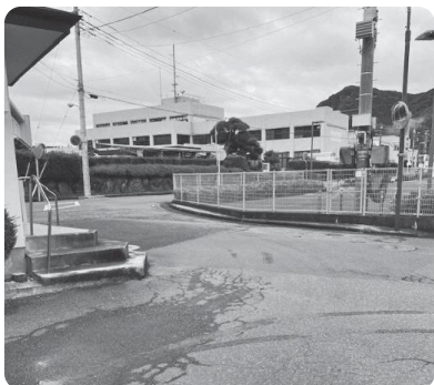
田京駅北、市道3001号線(クラック)