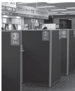
受け取りは伊豆長岡庁舎の市民課窓口へ