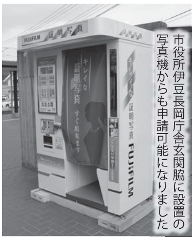
市役所伊豆長岡庁舎玄関脇に設置の写真機からも申請可能になりました

▼市役所から「個人番号カード交付のお知らせ」が自宅に届きます。お知らせに記載されている予約方法で必ず予約をしてください。 ▼必ず申請した本人が来庁してください。 ▼顔認証や暗証番号の設定など、15分程度の時間がかかります。