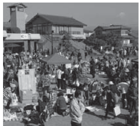
多くの人を訪れたフリーマーケット会場

▼秋らしい時期は一瞬で過ぎ去り、気づけばどこも冬模様。とるの戦いは手足の冷えと丸まっていた気持ち。強くなっている。玉 ▼今年が終わりますね。1年、振り返るとこの出がけはいいです。来年も、伊豆の国市のみならず、HAPPYに暮らせよう！