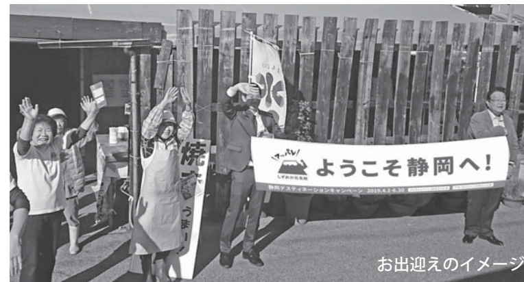
お出迎えのイメージ

DC期間中は、県内外から電車、バス、自家用車などを利用して多くの人が伊豆の国市を訪れます。伊豆の国市の良さを少しでも知っていただくために、観光業に携わる人はもとより、多くの市民の皆さんが「おもてなしの心」を持ってサポートしましょう。