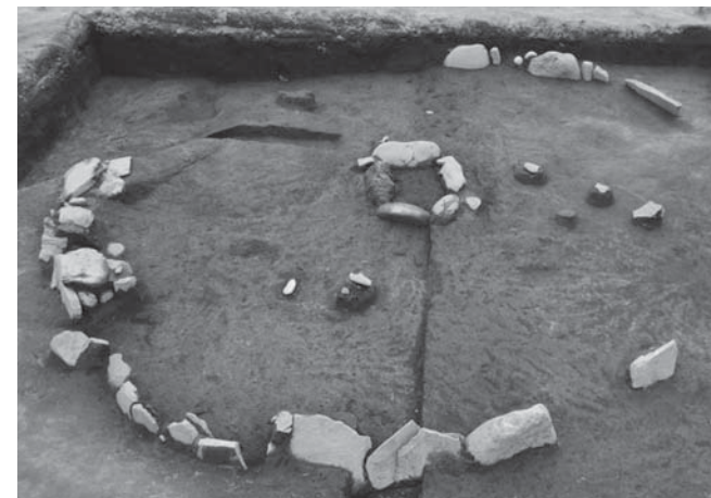
大庭遺跡 縄文時代の竪穴住居

市内には、地下に眠っている遺跡(周知の埋蔵文化財包蔵地)が230カ所、所在しています。これらの遺跡で発掘調査を行うことで、旧石器時代から近代に至るまでの、人々の暮らしを示す遺構や遺物が発見されることがあります。 今回は、平成29年度に実施した、大庭遺跡(田京)、横落B遺跡(三福)、北条氏邸跡(円成寺跡)(寺家)での発掘調査についてご紹介します。