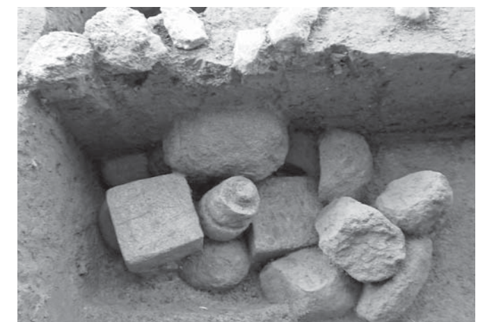
北条氏邸跡(円成寺跡)五輪塔が出した土坑

大庭遺跡では、縄文時代の竪穴住居を発見しました。住居の壁沿いには石が巡らされ、その中には祭祀のために使用されたと考えられる石棒も含まれていました。住居の中央には、長方形の石囲い炉があり、調理したり、暖をとったりしていたようです。このような形をした竪穴住居は、市内では、昭和54年度に発掘調査された仲道A遺跡(三福)に続いて、2例目の発見となりました。 横落B遺跡では、縄文時代の道具の主要な石材であった黒曜石の破片が多く出土しました。破片の状況から、矢じり(石鏃)などを作る際に生じたものであり、石器の製作工房があった場所と考えられます。 北条氏邸跡(円成寺跡)は、鎌倉北条氏の館跡、室町時代の円成寺の寺院からなる国指定史跡です。整備を目的とした発掘調査を実施したところ、円成寺に伴う池跡のほか、五輪塔(供養塔)の部材を埋