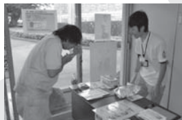
息を吹き込み、結果は...

東芝テック株式会社静岡事業所では、COPD(慢性閉塞性肺疾患)への理解を深めるとともに、自身の肺の健康状態を知り、健康意識を高めることを目的に、5月31日の世界禁煙デーにあわせて肺年齢測定会を行いました。