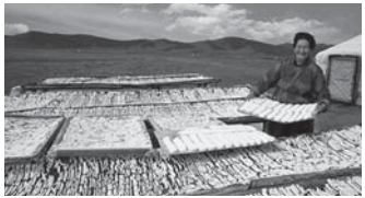
アロールを作る女性

私は小中学校の夏休みにモンゴル北部に住む遊牧民の叔父の家へ手伝いによく行きました。朝早く起き牛の乳を搾ってウルム、バター、アロール(保存食用の固いチーズ)を作り、夏休みが終わってわが家へ帰るころには、たくさんの乳製品をお土産に持って帰るのを楽しみにしていました。