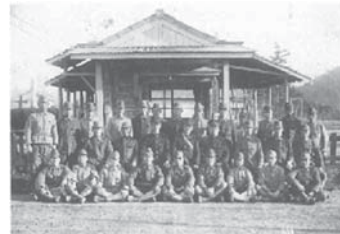
防空監視哨(大仁帝産台)

今年の8月15日で、太平洋戦争の終戦から73年を迎えます。かつては、身近にいる人から日常的に戦争の話が聞くことができました。しかし、戦争を体験した世代の高齢化によって、そうした機会がなくなりつつあります。戦時中の伊豆の国市の状況はどうだったのでしょうか。市郷土資料館では、夏の企画展として「モノが語る太平洋戦争」(※)を開催します。市が所蔵する戦時下の生活に関する資料を展示しますので、ぜひお越しください。 伊豆の国市は、隣接する沼津に軍事拠点(海軍工廠)があった事もあり、戦争と無縁ではありませんでした。本土への攻撃が激しくなると、沼津の海軍工廠が伊豆長岡に移転したり、大仁の帝産台(現在の大仁ホテル付近)には、防空監視哨(航空機を監視する見張り台)が築かれたりしました。民間人の中には、防空監視員に任命され、見晴らしの良い場所上空を