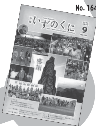
関連イベントを集めました。