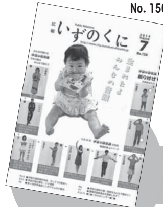
表紙では、踊り方を紹介しました。