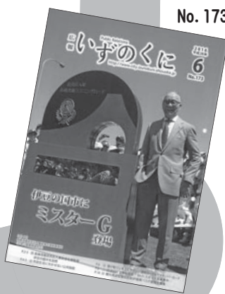
長嶋茂雄ランニングロードモニュメント前にて。