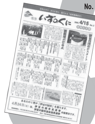
約3年間、新聞折り込みで発行していました。

合言葉は「Proud! Japan」。本号から1年間、東日本大震災の復興支援を追いました。