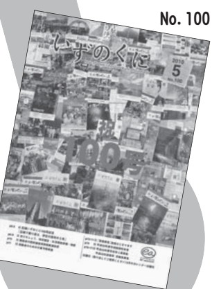
創刊から5年で、100号記念を迎えました。