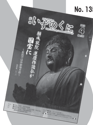
彫刻での国宝指定は、中部地方初の快挙でした。