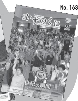
葦山反射炉世界遺産登録決定の「世紀の瞬間」です。