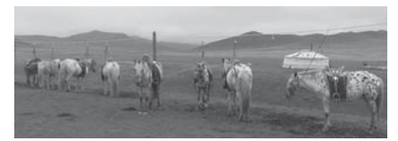
馬にも心地よい草原の風

皆さん、サエンバエーノ。今年の夏は特別な暑さだったと思います。が、皆さんはいかがお過ごしですか。気候変動を実感させるように、日本では猛暑が続き、普段は雨が少ないモンゴルは大雨で、各地に洪水予報が発表されているこの夏。私はモンゴル国訪問団に随行し、数日間でしたが、猛暑から逃れられました。 富士山静岡空港発のチャーター便により、日程は7月27日から8月1日までと決定。小野市長をはじめ、公式訪問団8人、伊豆の国市友好都市交流協会が募った海外研修に参加した中学生20人と引率者1人、合計29人がモンゴル国を訪問しました。 訪問団はソングノハイルハン区、モンゴル国体育・スポーツ庁などを表敬訪問し、中学生はナイラムダル国際子どもセンターで研修をしました。初めて行く人にはなんでも興味 深かったと思いますが、久しぶりに里帰りした私は、チンギスハーン国際空港から出た瞬間、涼しく吹く風が懐かしくて気持ちよかったです。 真夏とはいえ、太陽が沈むと気温は下がり、モンゴル人である私にさえ寒く感じました。ウランバートル市内の交通渋滞が心配でしたが、意外とスムーズに移動することができました。最近、モンゴル人が短い夏を楽しんで海外へ出かけて、里帰りする家族も多からだと思います。新学期が始まる9月1日から、久しぶりに街全体がにぎやかになることでしょう。 ☎ 市長公室 ☎ 055(948)1431