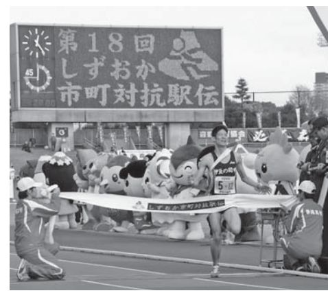
ご当地キャラに囲まれてゴール

スタート 10時(雨天決行) コース/12区間、42・195km(県庁前〜静岡市内〜草薙陸上競技場)