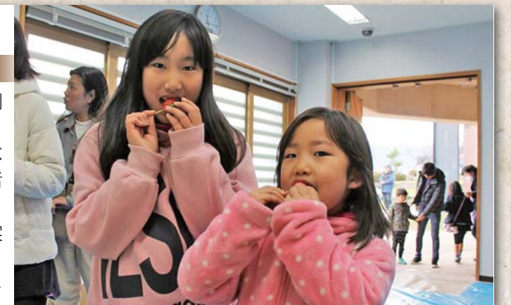
◀紅ほっぺときらび香を食べ比べる子ども▶

毎年恒例「伊豆の国いちごまつり」を葦山時代劇場で開催しました。当日は、「紅ほっぺ」と「きらび香」の食べ比べや、イチゴの販売などイチゴ盛りだくさん。来場者は、それぞれ思い思いにイチゴを楽しみました。また、会場ではさまざまなステージイベントも実施。会場を盛り上げました。