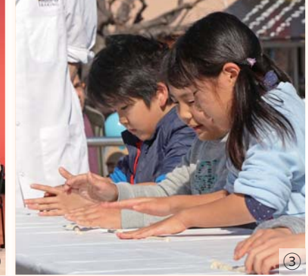
①全国高校生パンコンテスト実技審査 ②朗読劇& LIVEで江川太郎左衛門英龍に迫る ③より長く生地を伸ばそう ④6次化プロジェクト「いずろく」新商品を販売 ⑤パン作りを体験 ⑥巨大パンオブジェ「葦山反射炉とジオパーク」 ⑦伊豆半島をかたどったパン(プレス発表会にて)