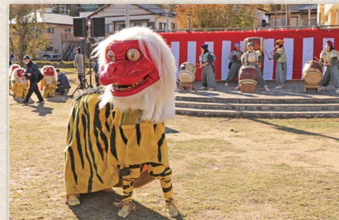
◀迫力ある大鶴の登場

源頼政が鶴を退治したという平安時代の故事に基づく奇祭「鶴ばらい祭」が、今年も湯らっくす公園で開催されました。長岡中生徒による鶴踊りでは、迫力のある鶴の動きや鶴退治が披露。ほかにも、伊豆中央高校生による弓のデモンストレーション、芸妓衆による踊りなどが行われ、会場は大いに盛り上がりました。