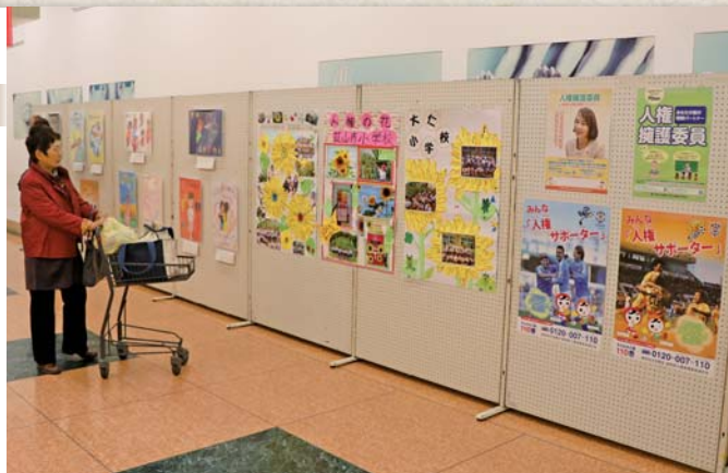
花パネルを見る来場者▶

市内小学生が制作した人権に関する作品を、アピタ大仁店で展示しました。この展示は、人権に対する市民の意識を高めることを目的としています。今年、葦山小児童によるポスター10点、葦山南小、長岡南小、大仁小による花パネル3点が展示。どの作品も、個性豊かな力作となっており、訪れた人たちは、時間をかけて眺めていました。