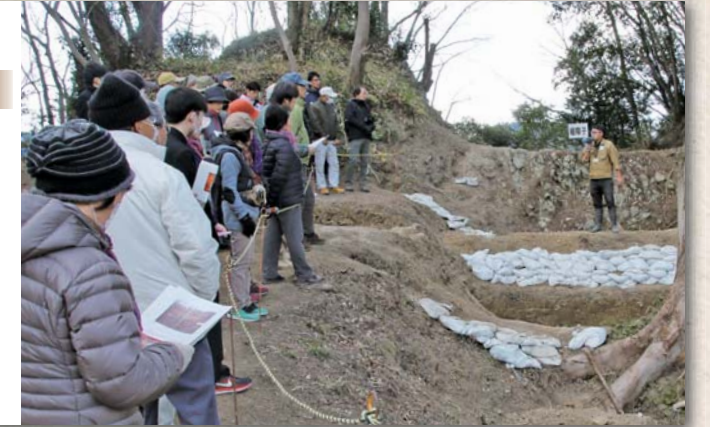
◀学芸員の説明に耳を傾ける参加者▶

葦山城跡「土手和田遺構群」発掘調査の成果を公開するため、現地説明会を開催しました。この場所は、葦山城の西側を固める守りの拠点としての役割を担っていたと考えられており、北条氏が城づくりによく用いていた「障子堀」が築かれています。約50人の参加者は、市文化財課の学芸員による説明を、興味深そうに聞いていました。