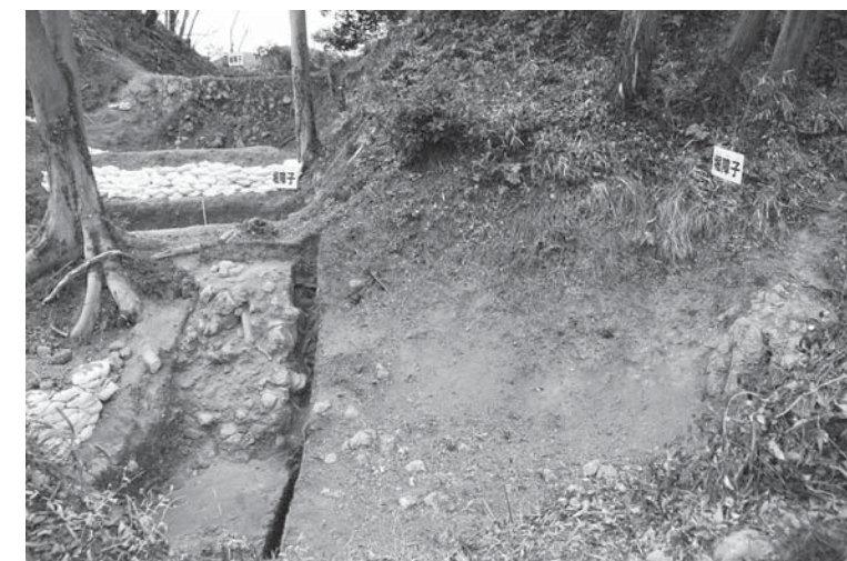
発掘調査で見つかった堀と障壁

た「障子堀」と呼ばれるものです。今回は、この堀の規模を確認するために発掘調査を実施しました。 今回の発掘調査では、現在地表面に残っている堀の幅や深さを確認するために、南北に縦断する調査区(1トレンチ)、堀の中にある障壁を確認するために東西の調査区(2トレンチ)を設定し、実施しました。 調査の結果、地中に埋もれていた本来の堀の形を確認することができました。堀は幅約5～6m、深さは一番深いところで約3mあり、山の岩盤を削り出して造っています。 そして、堀底には岩盤を削り残した障壁があることが分かりました。この堀と障壁を作る労力は決して簡単なものではなかったことでしょう。 今回の調査では、葦山城跡の丘陵部の堀の様子明らかとなり、また、遺構が良好な状態で残っていることが分かりました。 市では、今後も葦山城跡に関する調査を継続して実施し、歴史的事実の解