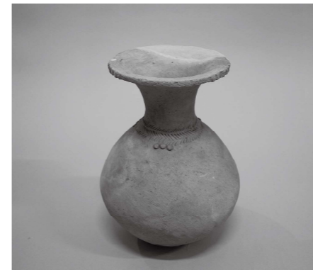
菊川市周辺の特徴を持つ土器

山木遺跡は葦山山木にある弥生時代後期から古墳時代前期（約1800～1700年前）を中心とした遺跡です。これまでの発掘調査では、当時の水田やお墓などともに、多くの土器、農具や建築部材などが出土しています。特に、木製の農具や建築部材は、当時のくらしや文化を知る上で貴重な資料であると評価され、国の重要有形民俗文化財に指定されています。 一方、土器は、他地域から運ばれて来た土器（外来系土器）の割合が高いことが大きな特徴です。