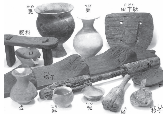
▲出土した土器や木製品

この遺跡では、弥生時代後期～古墳時代前期(約1,500～1,800年前)にかけての水田跡や、方形周溝墓、平安時代の水田跡などが発見されています。遺物では土器や木製品が出土しています。その内239点が、昭和41(1966)年に国の重要有形民俗文化財に指定されました。主に、壺や高坏などの土器、梯子やねずみ返しなどの建築部材、大足や田下駄などの農具、皿や片口などの容器、杵や槌などの日常雑器などの木製品があります。中でも、ねずみ返しは、柱にはまった状態で発見さ