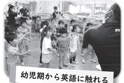
幼児期から英語に触れる

☎ 学校教育課 ☎ 055-948-1444 ☎ 幼児教育課 ☎ 055-948-1447