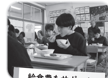
給食費もサポート

市内の小・中学校や保育所などの給食費に対して、物価高騰に伴う食材費の高騰分を市が負担し、保護者の負担増加を抑制します。