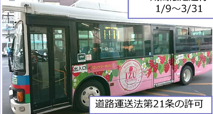
道路運送法第21条の許可