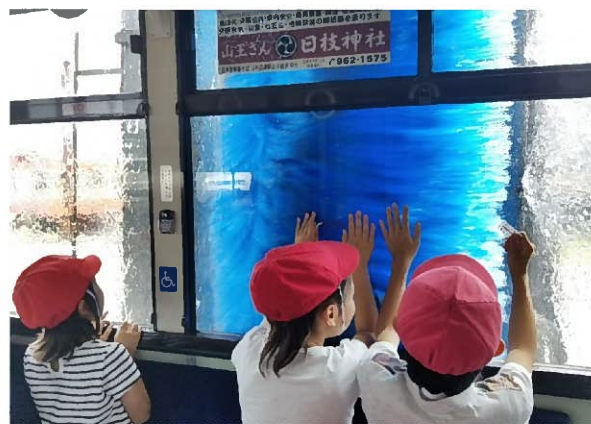
バス専用の洗車機を体験(すご〜い！と歓声！)