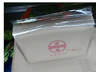
アンケート回答者へのノベルティ