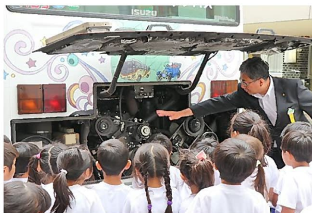
エンジンルームを見てみよう(こうなっているんだ！)