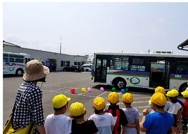
内輪差の実験(風船は割れちゃうのかな?)