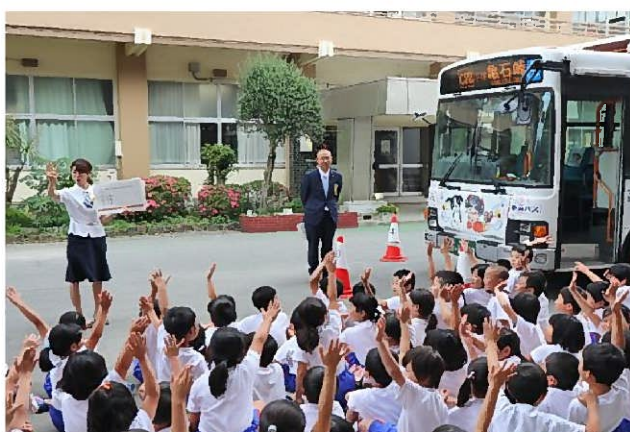
紙芝居式クイズに挑戦(たくさん手が挙がります！)