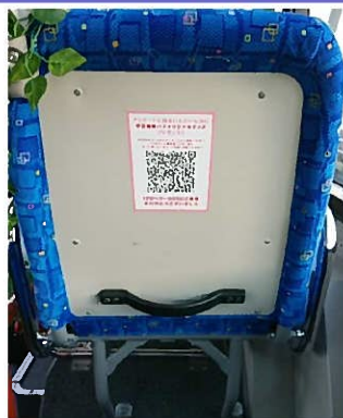
アンケート依頼 (QRコード読み取り)