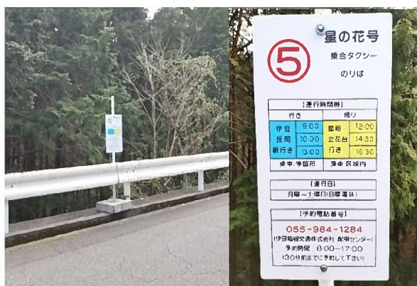
【星の花号/停留所看板】