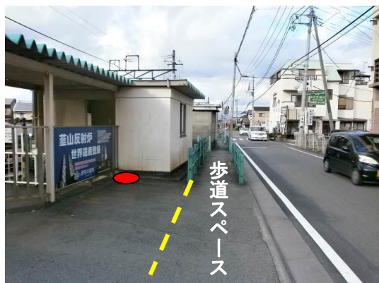
・バス停設置位置(北方向撮影)