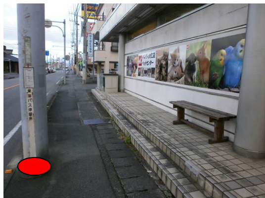
・すみや前(北方向撮影)