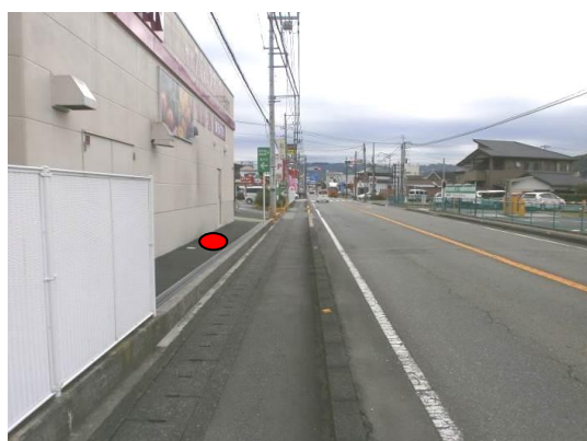
・MV大仁店前(南方向撮影)