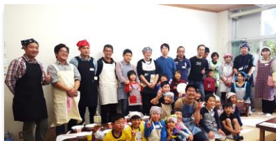
↑会員交流会（年数回）↓