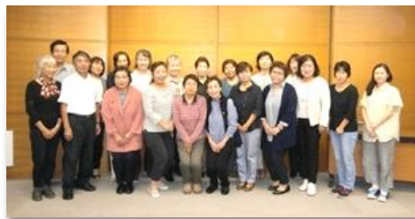
↑まかせて会員養成講座↓

「子育ての手助けをして欲しい人」と「お手伝いをしたい人」をアドバイザーが結ぶ、地域のみんなで子育てを支え合う事業です。利用には会員登録が必要です。 (登録は無料、サポートは有償です)