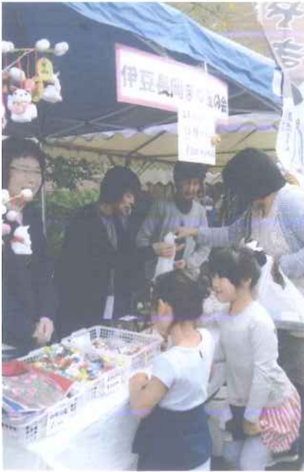
10月14日 まんじゅう祭