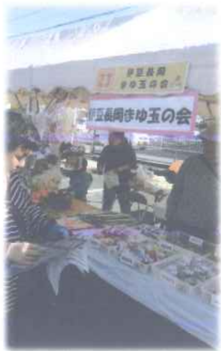
10月28日アピタ産業まつり