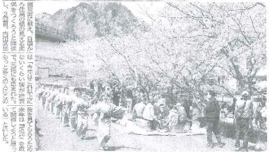
伊豆の国市音楽保存会の踊りや花見を楽しむ住民＝同市大仁

ステージでは伊豆をPRするダンス・ボーカル・ユニット「あいぜつちゅー」や市音楽保存会、地元のおやしバンドが出演し、お花見会を盛り上げた。近くの古木公園に、飲食などの出店も並んだ。地震、水害など大規模