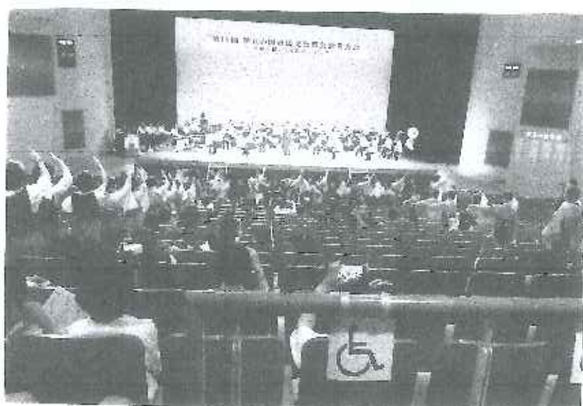
10/7 伊豆の国市文化祭