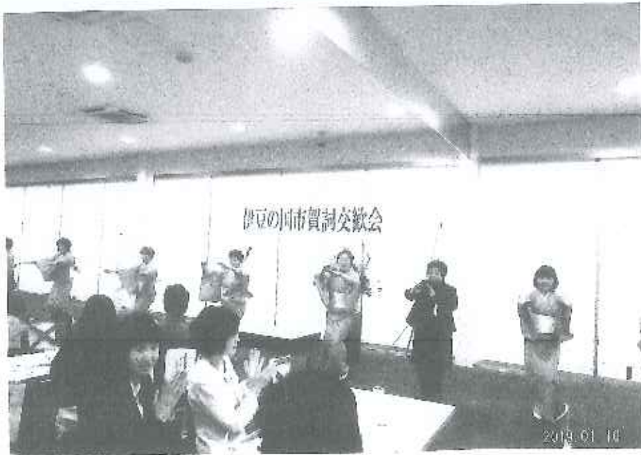
1/10 伊豆の国市 賀詞交歓会