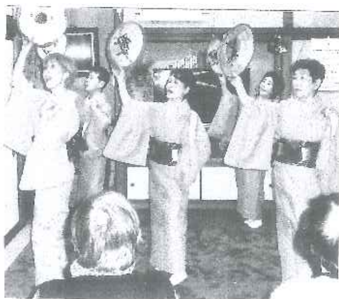
12/25 グループホーム カナリヤ