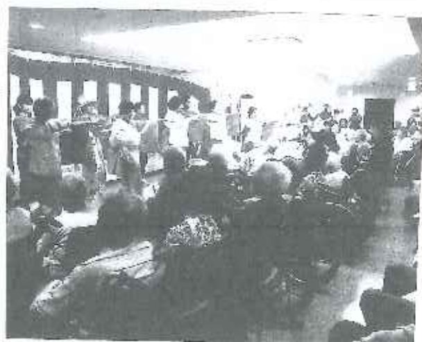
10/7 特養ぶなの森 秋祭り