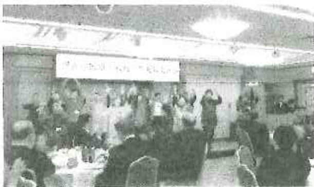
長岡京市にて交流会