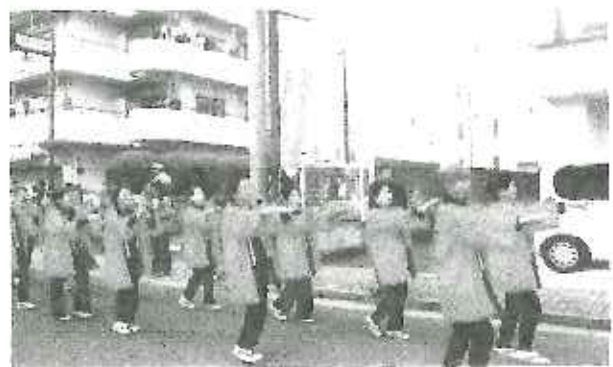
ガラシャ祭り パレード参加