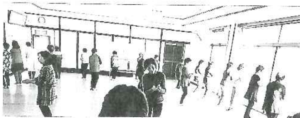
練習風景…山木産業会館にて