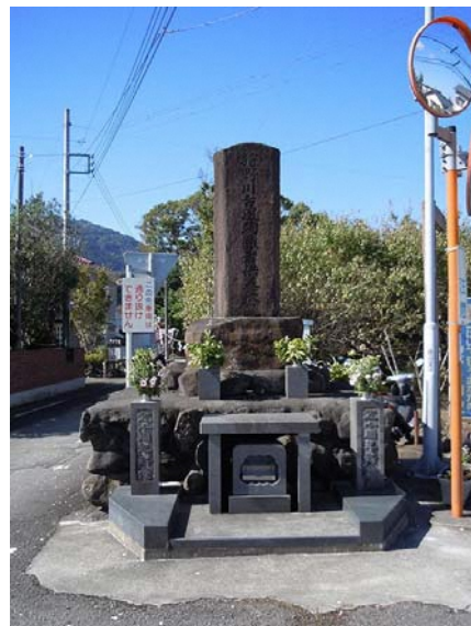
狩野川台風殉難者供養塔 (白山堂地区)

また、盆の時期に限らず、慰霊碑の前を通る地元の市民が、足を止めて手を合わせている姿が、今もなお見受けられる。狩野川台風の犠牲者に対する鎮魂の営みは、発生後約60年を経た現在でも、人々の暮らしの中に織り込まれているのである。