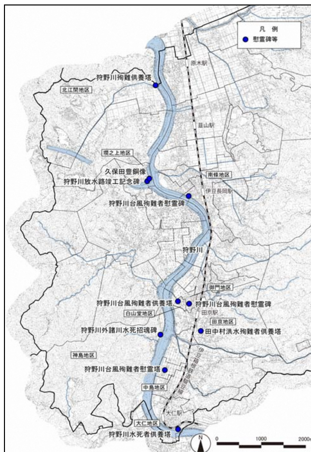
図 2-2-1 狩野川水害慰霊碑および関連石碑等位置図