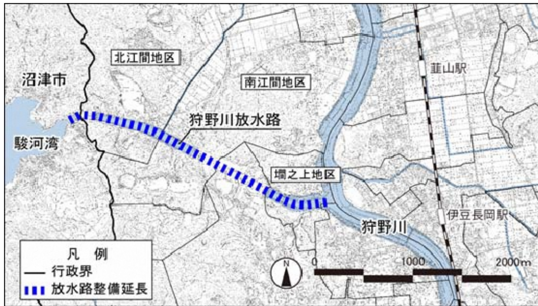
図 2-2-8 狩野川放水路位置図

た。死者・行方不明者 1,040 人を出す未曾有の災害であった。狩野川台風の影響は、放水路計画の見直しを迫り、当初 1,000 m 3 毎秒としていた放水路への分派量を 2,000 m 3 毎秒へと変更した上で工事が続けられ、昭和 40 年(1965)、狩野川放水路はついに竣工を迎えた。狩野川放水路の完成とその後の堤防整備・揚水機場整備等により、狩野川流域の水害は画期的に減少することとなった。そして、狩野川放水路は、完成から 50 年以上を経て、なお狩野川流域の水害対策の要となっている。