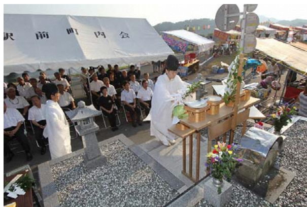
狩野川台風慰霊祭の様子