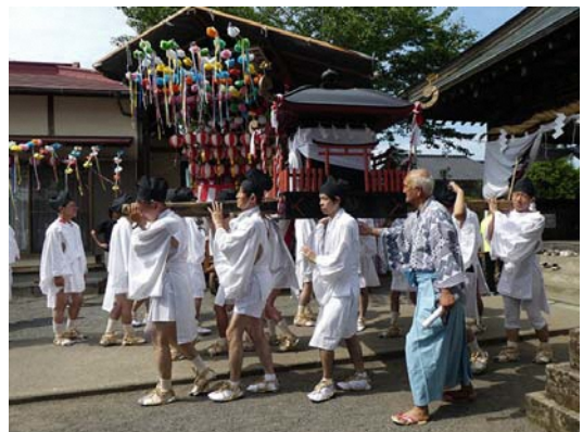
お天王さん 八坂神社を出発