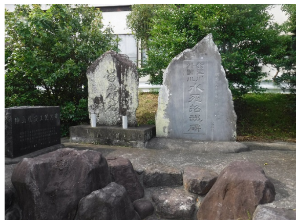
狩野川外諸川水死招魂碑 (神島地区)

神島地区の記録によれば、同地区岩崎にある狩野川外諸川水死招魂碑の前では、明治 39 年(1906) 4 月の招魂碑建立以降、毎年 8 月 2 日に「岩崎念仏」を唱える「水難供養祭」を行っている。この供養祭は、かつては地区の婦人会が中心となっていたが、現在は神島区が主体となり、地区の女性たちが参加して行われている。