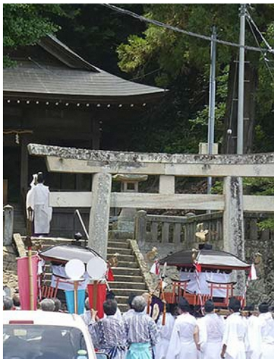
守山八幡宮での祈禱