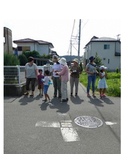
神輿の通り道にお供えを持った地域の人々が出ている