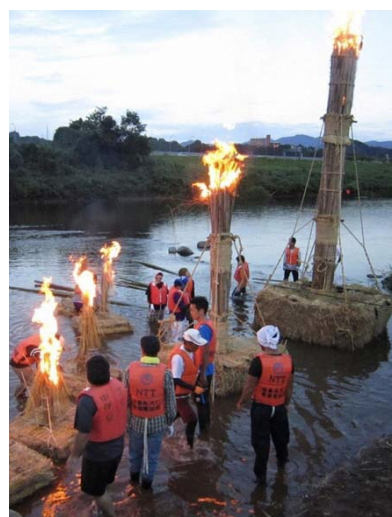
筏を川に運ぶ様子