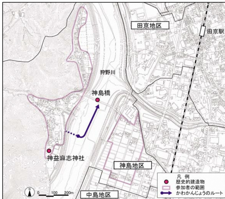
図 2-2-3 かわかんじょう 活動範囲の拡大図

川を下る。その際、若者たちは「うっ、うっ、うあ、はい」という独特の囃し声を川岸にいる地区の子どもたちに掛ける。子どもたちもまた「うっ、うっ、うあ、はい」と返す。この掛け合いを繰り返し水面に響かせながら、筏は神島橋の下流まで流されていく。かわかんじょうは、昭和 33 年(1958)の狩野川台風を境に、筏の材料の減少や、祭の担い手不足により簡略化される傾向にあったが、昭和 56 年(1981)には保存会が発足、今日まで保存会により継承されている。現在は、かわかんじょうの終了後に行われる「大仁夏祭り」の一部としても位置づけられている。