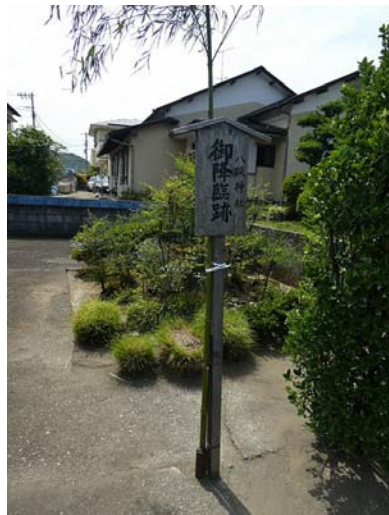
牛頭天王 降臨の地