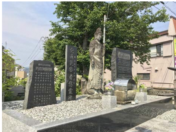
狩野川台風殉難者慰霊碑 (南條地区)