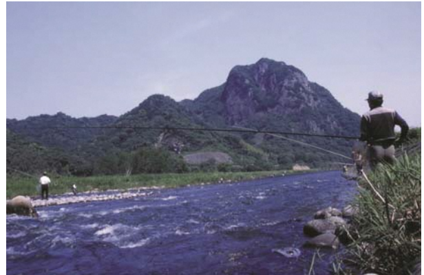
狩野川での鮎釣り

伊豆の国市の平野部中央を北流する狩野川 かののがわ は、古来より、人々の暮らしと密接に結びついている。農業用水として、流域の田畑を潤してきたのはもちろん、陸上交通の整備が進むまでは、舟運による輸送経路として、重要な役割を果たしてきた。鎌倉幕府の執権北条氏の館（史跡北条氏邸跡・円成寺跡）が、狩野川に臨む守山の麓に営まれたのも、交通路としての狩野川の重要性によるところが大きいと考えられる。江戸時代には、河口の沼津港から狩野川各所に設けられた河岸を結ぶ、物流のネットワークが形成されていた。