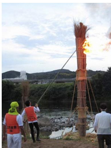
松明への点火の様子