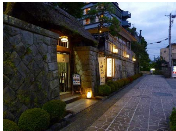
古奈温泉街 あやめ小路