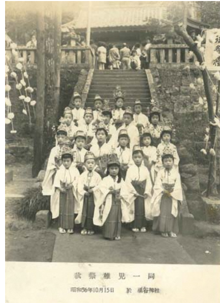
昭和36年の稚児の集合写真

温泉神社の例祭は、良質な温泉の湧出に感謝する祭で、毎年3月末に、伊豆長岡温泉旅館協同組合を実施主体として執り行われている。この例祭には、温泉旅館関係者をはじめ、芸妓衆も参加して祭に華を添えている。また、例祭に前後して湯汲み式と餅撒きが行われる。