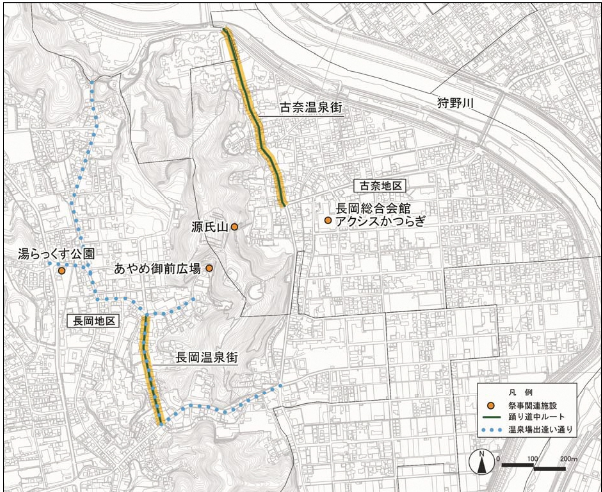
図 2-4-1 源氏あやめ祭範囲図