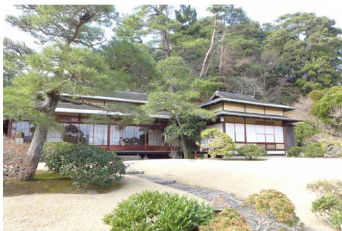
三養荘本館 居間・書斎棟

三養荘の名は久彌の命名になるもので、『養生雑訣』に「思慮 すくな を寡くして以つて神を養ひ、嗜欲 しよく を寡くして以つて精を養ひ、言語を寡