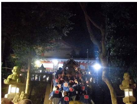
宵宮祭 湯谷神社に向かう神輿

湯谷神社では、例年 10 月 9 日に宵宮祭、同 10 日に例大祭が行われている。氏子への聞き取りによれば、少なくとも明治時代以降継続して実施されているという。宵宮祭では、本殿にて神職による神事が執り行われた後、三つの神輿が古奈地区の各旅館に立ち寄りつつ練り歩く。