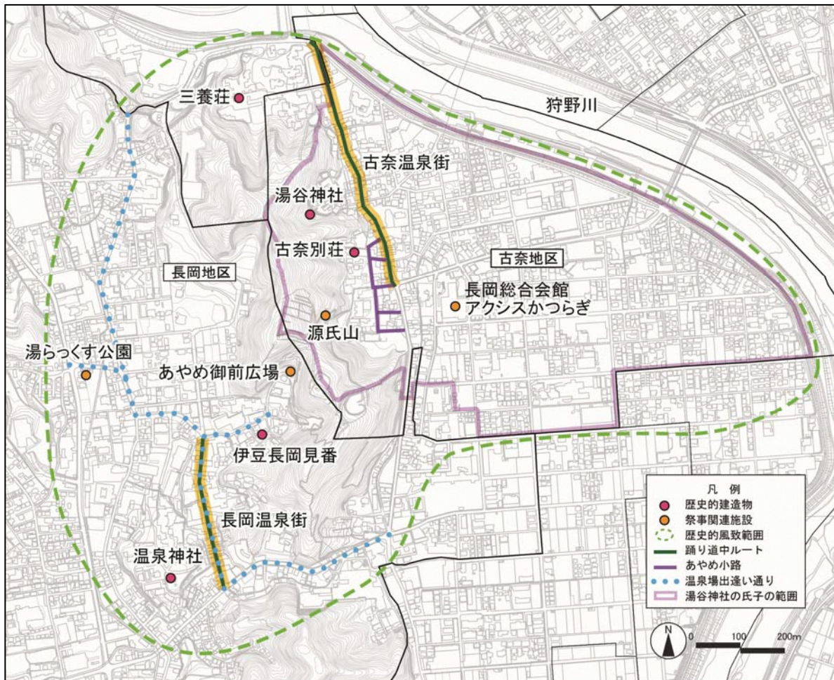
図 2-4-3 歴史的風致範囲図

古くからの湯治場である古奈温泉と、近代に入って湧出した長岡温泉は、伊豆長岡温泉として、芸妓文化を含む温泉街の文化や景観を育んできた。そうした営みの中で、土地に伝わる祭のみならず、源氏あやめ祭も多くの回数を重ね、地域の伝統として定着している。昭和初期の建築を含む温泉街の景観とも相まって、後世に伝えていきたい良好な歴史的風致を形成している。