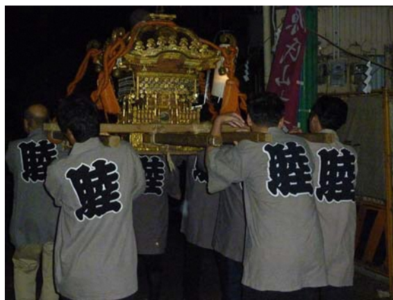
宵宮祭 古奈地区を練り歩く神輿