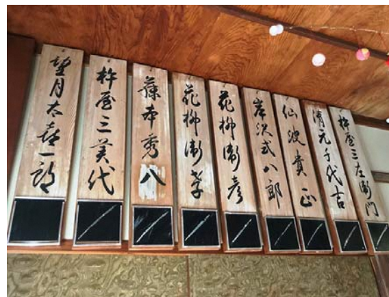
右 見番の玄関に掲げられた師匠方の名札 左「公認静岡県芸妓学校」の看板

波流の鳴物等を師匠から習い、また稽古を積んで腕を上げていく。なお、初めて入門した半玉(芸妓の見習)は、まず「見かえり富士」と「あやめ音頭」という長唄や舞踊の稽古をすることとなっており、このしきたりは今日も続いている。