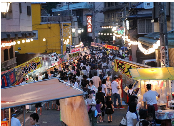
長岡温泉街 温泉場出逢い通り 源氏あやめ祭の様子

古奈温泉には、古くからの旅館が軒を連ね、風情のある「あやめ小路」があり、そこには当時化粧メーカー大手であった株式会社ウテナの創業者、久保政吉の別荘として昭和9年(1934)に建てられた、3棟の近代和風建築を前身とする「古奈別荘」がある。また、古奈温泉の北端に位置する「三養荘本館」も、三菱財閥の3代目総帥岩崎久彌の別荘として建てられた昭和初期の近代和風建築であり、古奈温泉を代表する建造物のひと