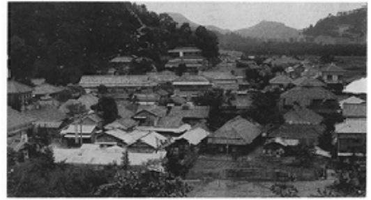
かつての古奈温泉の様子

伊豆長岡温泉とは、長岡地区に所在する古奈温泉・長岡温泉の総称である。この内、古奈温泉は、源氏山と呼ばれる小高い丘の東麓に湧出している。『吾妻鏡』にもその名が見え、鎌倉時代から湯治場として知られてきた歴史ある温泉である。一方、長岡温泉は明治40年(1907)、源氏山南麓において掘削により湧出し、大正・昭和期を通じて発展していった。古奈温泉には湯谷神社、長岡温泉には温泉神社といういずれも温泉に関わりのある神社が鎮座している。