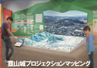
葦山城プロジェクションマッピング