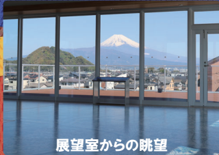
展望室からの眺望