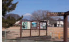
▲伝堀越御所跡から富士山を望む