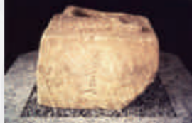
▲石櫃 若舎人の刻銘がある（国重要文化財）

7 世紀前半から 8 世紀中頃に造られた横穴群です。北江間横穴群は、大師山横穴群や大北横穴群など複数の横穴群の総称です。高さ 2 m を超える横穴がわずかに 30 cm ほどの小さな横穴まで、大北横穴群は、多種多様な横穴墓が凝灰岩の岩盤に 50 基以上掘られており、発掘調査では石櫃や須臾器等が出土しています。大北 24 号横穴から出土した石櫃には「若舎人」と刻まれ、8 世紀初頭の文字資料として国の重要文化財に指定されています。