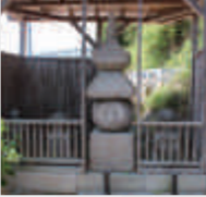
▲足仙丈和尚五輪塔

鎌倉時代末～南北朝時代にかけての年号を刻んだ石造物群です。中でも足仙丈和尚五輪塔と呼ばれる五輪塔には正安 4 年（1302）の銘が刻まれており、これは静岡県内の五輪塔で最も古い銘で、県の有形文化財に指定されています。 八重姫御堂で有名な真珠珠の境内にあります。 ▲足仙丈和尚五輪塔