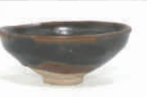
▲北条氏館の天目茶碗