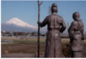
▲頼朝・政子夫婦の像

永暦元年（1160）、伊豆に流罪となった源頼朝が、平家追討を目指して挙兵するまでの約 20 年間を過ごしたとされる場所です。現在は公園として整備され、頼朝と北条政子の像や、蛭島という文字が刻まれた江戸時代の石碑が建っています。