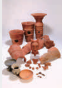
多田大塚 6 号墳出土遺物▶

5～6 世紀に造られた、10 基の古墳からなる古墳群です。このうち、5 世紀中頃に築造された 4 号墳の石室から短甲・鏡・太刀等が出土し、5 世紀末～6 世紀初め頃に築造された 6 号墳は伊豆地域では珍しい帆立貝形の古墳で、盾持人埴輪等多数の埴輪が出土しました。