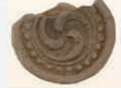
▲国史跡願成院跡から出土した瓦