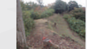
▲本丸跡から堀倉址方面