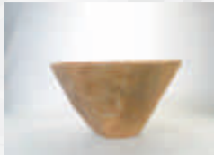
▲仲道 A 遺跡出土の縄文土器

縄文時代の集落跡です。伊豆で最も古い、縄文時代草創期の土器（県指定文化財）が出土したことで、この地に早くから人々の暮らしがあったことが判明しました。