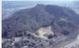
▲北条氏邸跡（円成寺跡）の全景

北条氏滅亡後、14 代執権北条高時の母、寛海円成は北条氏の女性たちとともに伊豆に移り、一族を鎮魂するため円成寺を建てました。円成寺は関東管領山上杉氏の庇護を受けながら存続しました。発掘調査では仏具や茶の道具などが見つかっています。