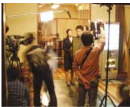
ドラマ撮影の様子(写真は南山荘)

二月十五日から二十五日にかけて、市内で、TBS月曜ミステリー劇場「どケチ弁護士 山田播磨の温泉事件記」(出演・武田鉄矢氏ほか、脚本・西岡琢也氏、演出・大岡進氏)のロケ(撮影)が行われ