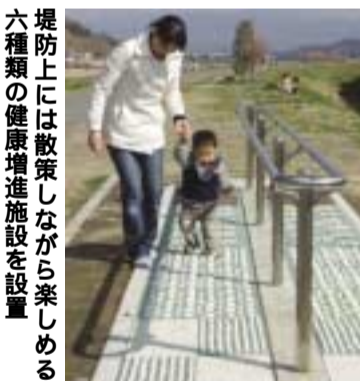
堤防上には散策しながら楽しめる六種類の健康増進施設を設置

五十本の河津桜を植樹しました。今年は開花が遅かったため満開は三月上旬でしたが、例年は一月末から花が開き、二月末には満開を迎えます。 この河川区域は、国土交通省の「ふるさとの川整備事業」実施地域に指定されているため、桜並木だけでなく、広い天端と緩やかな傾斜を備えた堤防、腹筋や足ツボ刺激などができる健康増進施設六カ所、手作りベンチ、水洗トイレ二基、駐車スペースなどが整備されています。一年を通じてここを訪れる人は多く、ウォーキングや犬の散歩など