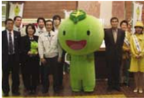
みんなでねんりんピックを盛り上げよう!

チャッピーがきた! ねんりんピックキャラバン隊 来庁 二月二十日、ねんりんピック静岡2006キャラバン隊が、市役所伊豆長岡庁舎を訪れ、石川嘉延県知事のメッセージが伝達されました。庁舎では、助役や高齢者支援室などの市職員が、大会マスケット・チャッピーらキャラバン隊を出迎えました。 ねんりんピック静岡2006では、十月二十九日(日)・三十日(月)に、葦山運動公園でペタンク競技を行います。その二日間、全国からの選手団が伊豆の国市にやって