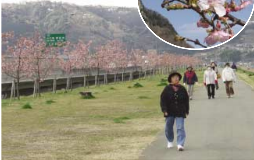
堤防上でウォーキングを楽しむ人々。早咲きの桜の見頃は例年1月末～2月末

チャッピーがきた! ねんりんピックキャラバン隊 来庁 二月二十日、ねんりんピック静岡2006キャラバン隊が、市役所伊豆長岡庁舎を訪れ、石川嘉延県知事のメッセージが伝達されました。庁舎では、助役や高齢者支援室などの市職員が、大会マスケット・チャッピーらキャラバン隊を出迎えました。 ねんりんピック静岡2006では、十月二十九日(日)・三十日(月)に、葦山運動公園でペタンク競技を行います。その二日間、全国からの選手団が伊豆の国市にやって