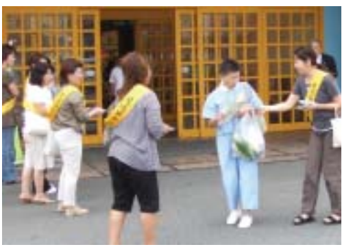
交通事故防止を呼びかけるキャラバン隊

全国各地を巡回しながら交通事故防止を呼びかける交通安全啓もう全国キャラバン隊が、八月三十日に伊豆の国市を訪れました。