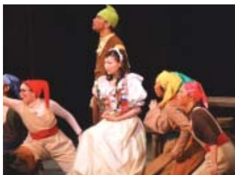
大人も子どもも、舞台にくぎ付け

八月十九日、蕪山時代劇場大ホールで、白雪姫と七人のこびとゆきひめと七にんのこびと公演を行いました。来場した三百七十人は、白雪姫の世界に引き込まれ、愛と友情のお話を楽しみました。