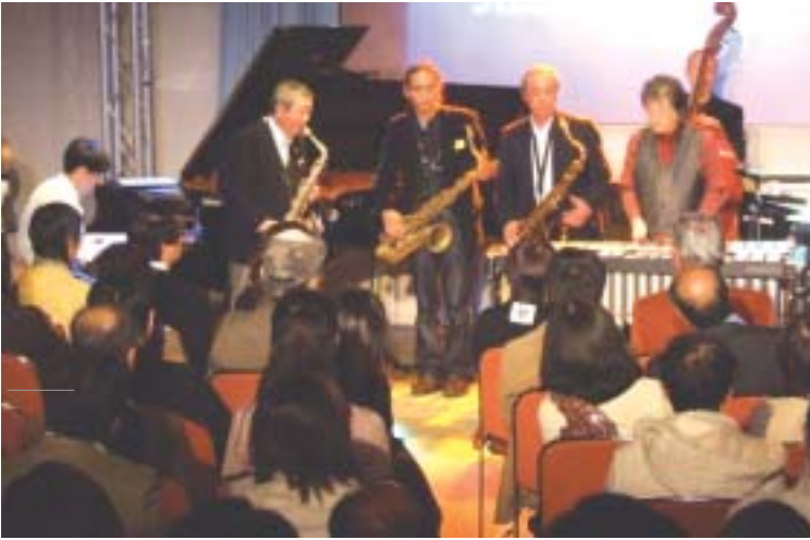
四部でのクライマックスシーン

十一月二十三日、二十四日に葦山時代劇場で、『2007 第二回 葦山時代劇場ジャズフェスティバル』を行い、市内外から約六百七十人が来場しました。今年には四部構成で、一部・三部はアマチュアステージ、二部・四部はプロステージとして行い、どの出演者も素晴らしい演奏で、来場者は音楽に合わせて手拍子や歓声を挙げてジャズを楽しんでいました。