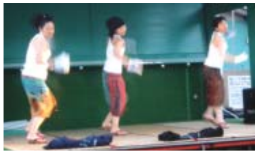
温泉街を盛り上げる、下駄の新しい活用法『下駄ダンス』

旅館や市民らが使った約三百五十足の下駄を集めたかがり火台を、塩や酒でお清めして火をともし、役目を終えた下駄を供養しました。今年には芸妓連による踊りのほか、下駄ダンスコンテスト出演者のパフォーマンスマスも披露され、会場を盛り上げました。