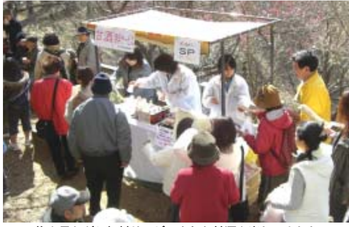
梅を見ながら無料サービスされた甘酒を楽しみました

神社境内では、雅楽や民謡などの披露のほか、屋台も出店され、商工会が開発した『伊豆の国パン』の伊豆パンも初めて販売されました。これは、国の補助を受けて商品開発を進めていた土産用のパンで、アユ・ワサビ・イチゴ・シイタケ・黒米を使ったパン