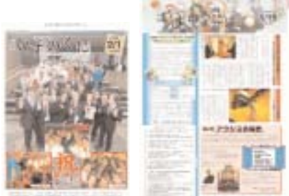
回答数：96通 回答数：187通