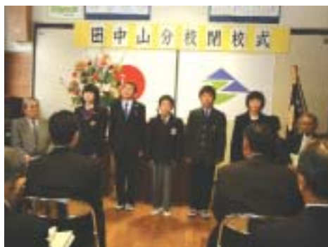
出席者は卒業生の発表に聞き入りました

市内在住の70歳以上の人に『めおと湯の館無料利用券』をめおと湯の館で発行します。 持ち物 身分を証明できるもの(健康保険証、運転免許証など) 内容 年12回分の無料利用券 営業時間 10:00 ~ 19:30 *木曜休館 問合せ めおと湯の館 電話 055 949 3737