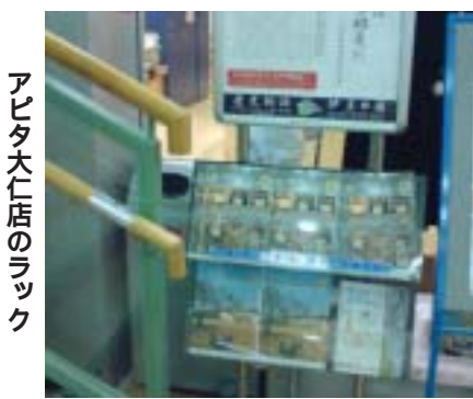
アピタ大仁店のラック

*各施設のラックは、時期により品切れすることがあります。その場合は、市役所各庁舎へお越しください。