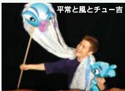
平常と風とチュー吉

と き 8月17日(日) 午前の部:開場 10:30 開演 11:00 午後の部:開場 13:30 開演 14:00 ところ 葦山時代劇場映像ホール チケット【全席自由】 一般 1,000円、中学生以下 500円 (3歳未満無料)