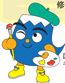
国民文化祭マスコット キャラクター「ふじっぴー」