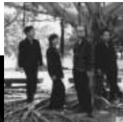
夏川りみ アコースティック・パーシャ

『涙そうそう』の夏川りみによる沖縄スペシャルライブ。 とき 8月16日(土)開場 18:00 開演 18:30 ところ アクセスクつらぎ大ホール チケット【全席指定】S席 5,000円、A席 4,000円 *未就学児の入場はできません。 問合せ アクセスクつらぎ 電話 055 948 0225