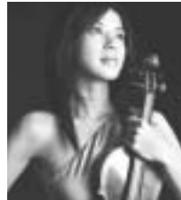
川井郁子 (ヴァイオリン)

とき 7月13日(日) 開場 13:30 開演 14:00 ところ 葦山時代劇場大ホール チケット【全席指定】3,500円 (料金一律)