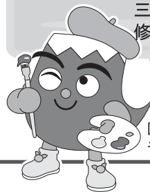
国民文化祭マスコット キャラクター「ふじっぴー」