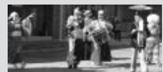
昨年の様子(ちんどん研究会)

なお、各部門の申込書は社会教育施設(あやめ会館・葦山農村環境改善センター・大仁市民会館)で配布しています。