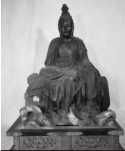
北條寺・木造観音菩薩坐像

*詳しくは、月のカレンダー(広報にはさみ込み)・図書館ホームページ・各図書館配布の図書館カレンダーをご覧ください。