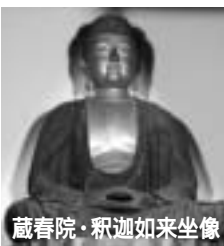
蔵春院・釈迦如来坐像