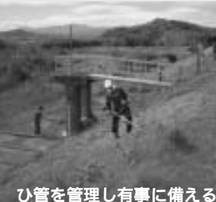
ひ管を管理し有事に備える