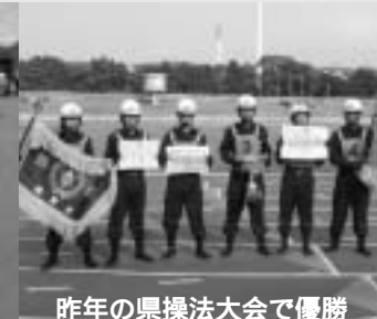
昨年の県操法大会で優勝