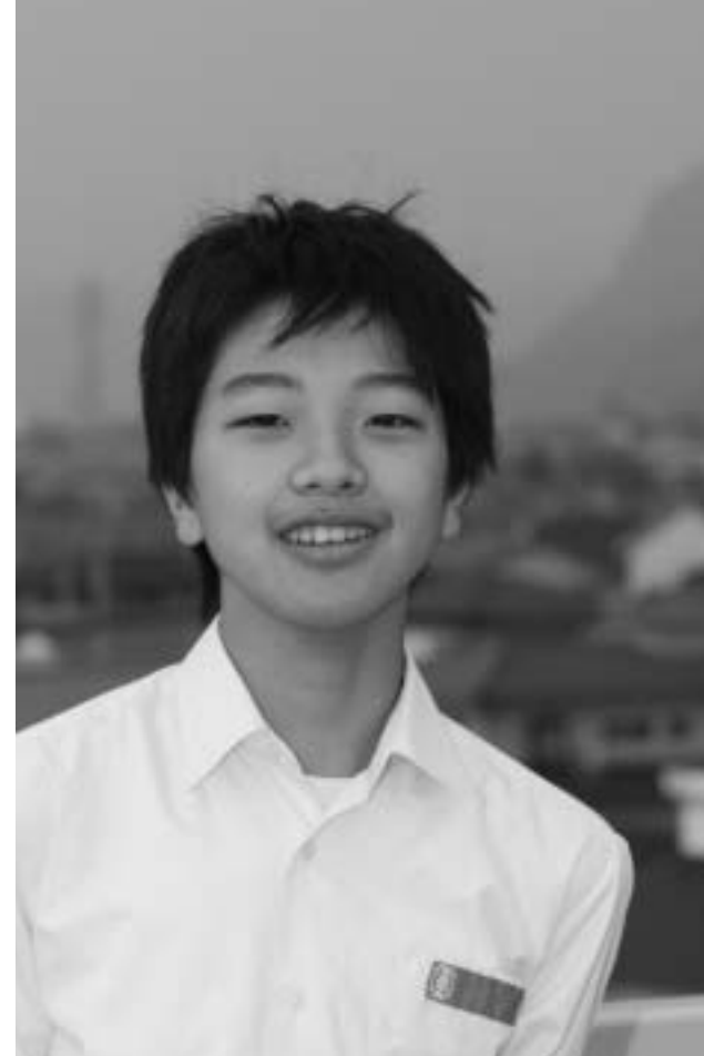
『狩野川新能』は3ページ記事参照

問合せ / すその阿波おどり大会実行委員会事務局 電話 055 992 7311