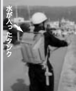
花火の飛び火処理には「シューター」で出動

水が入ったタンク 真)を背負って飛び火処理、子ども会キャンプではキャンプファイヤーの見張り役、防災訓練では消火技術の指導、一月の毘沙門堂だるま市ではだるま販売など、地元の行事に積極的に参加しています。(渡辺分団長より)「僕たち第六分団は主に奈古谷地区を中心としたメンバーで活動しています。幼少のころから一緒に遊んだ仲間が多く、普段は階級に関係なく和気あいあいと活動していますが、いざというときの結束力は、どこの分団にも負けないと思います」。