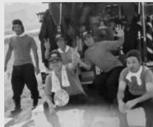
幼いころからの仲間が多い第6分団「いざというときの結束力はどこにも負けない!」