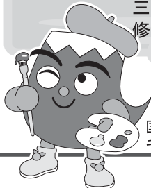
国民文化祭マスコット キャラクター「ふじっぴー」