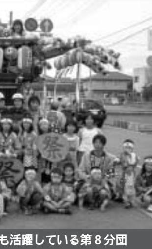
若宮神社祭典など地域の行事でも活躍している第8分団