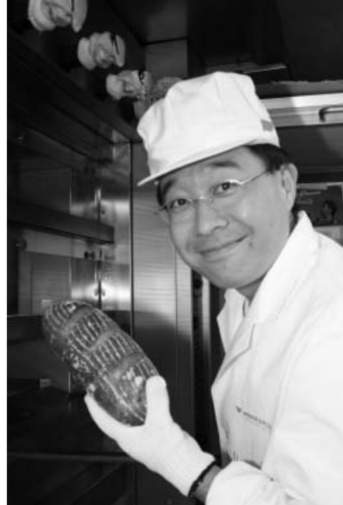
『パン祖のパン祭』の詳細については12ページ記事を参照