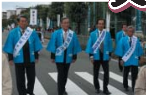
両市の市長・議長が並んで参列