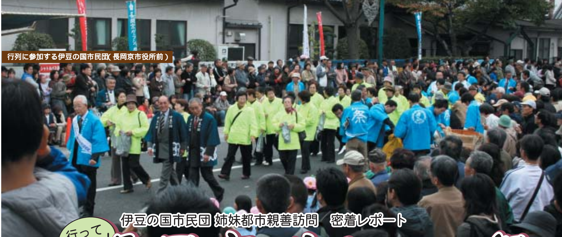
行列に参加する伊豆の国市民団(長岡京市役所前)

今回で4回目の訪問団参加になります。今月28日の交流会で長岡京市の方と再会できるのが楽しみ。これからはイベントだけでなく、文化・芸能団体同士の交流へと発展していけることを願っています。