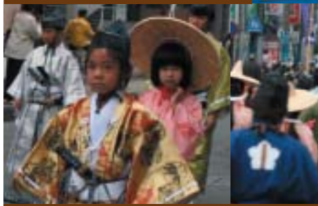
約1,200人の大行列を見ようと約55,000人の観衆が詰めかけました。

昨年11月8日・9日、市民と市長、市議会議員ら計39人が、姉妹都市である京都府長岡京市を訪れ、『長岡京ガラシャ祭2008』に参加しました。毎年恒例となっている市民団訪問ですが、今回もまた長岡京市の皆さんは、熱烈な歓迎をしてくれました。