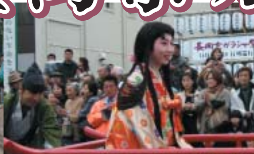
お玉の輿入れは行列の花形