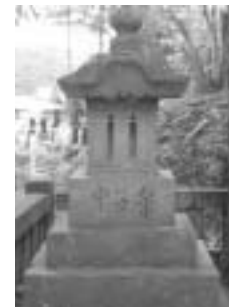
習字の師匠をしのんで弟子たちが建てた記念碑「筆子塚(天保9年・1838年)」