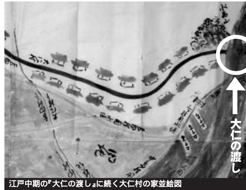
江戸中期の『大仁の渡し』に続く大仁村の家並絵図