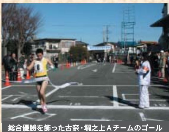
総合優勝を飾った古奈・壺之上Aチームのゴール

2/1 古奈・壺之上Aが優勝 第四回伊豆の国市駅伝大会 大仁市民会館をスタートとゴールに、八区間二十・六四キロを走る、伊豆の国市駅伝大会を開催。五部門計五十一チームの選手たちが、快晴の中、たすきをつないで走りました。 総合優勝を飾ったのは、古奈・壺之上Aチーム（一時間十四分五秒）でした。各部門の上位は次のとおり。 【地区の部】 古奈・壺之上A、小坂・富士見・長瀬・戸沢A、原木 【一般の部】 ボモドーロA、東京電力伊豆支社、レインボー 【中学男子の部】 葦山二年、長岡A、大仁一年 【中学女子の部】 大仁、長岡A、葦山二年 【小学生の部】 葦山走ろう会、大仁少年サッカークラブ、伊豆長岡AC