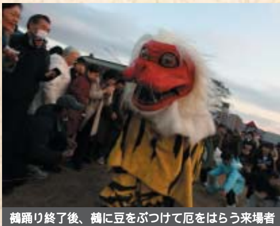
鶴踊り終了後、鶴に豆をぶつけて厄をはらう来場者

1/28 豆ぶつけて厄ばらい 伊豆長岡温泉鶴ばらい祭 今年も伊豆長岡温泉街で「鶴ばらい祭」を開催しました。 鶴は、頭が猿、胴体が虎、尾が蛇という伝説の妖怪。「鶴ばらい祭」は、このおそろしい鶴を、あやめ御前の夫・源頼政が退治したという逸話にちなんだお祭りです。 鶴や、頼政ら鎧武者に扮した長岡中学校の生徒たちは、長岡・古奈の両温泉街をパレードし、湯らつくす公園やアクシスカつらぎを会場に、伝統の「鶴踊り」を披露。その後、鶴は来場者から豆をぶつけられ、みんなどの一年の厄ばらいをしました。 また各会場では、鶴や鎧武者、伊豆長岡芸妓連らによる幸福の餅まきも行われ、祭りは今年も盛況のうち幕を閉じました。