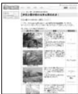
パソコン版も必見!

表紙は、江川邸裏にある、城池親水公園の桜(今年の写真ではありません)。現在、市ホームページでは市内の桜の名所と開花情報を配信中です。さあ携帯電話片手に、桜の名所を巡る旅に出しましょう。パソコン版はさらに詳しい情報も公開していますので、両方とも要チェックです!