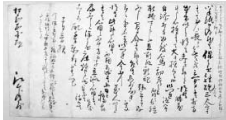
(写真上)7年間の「江川文庫総合調査」で確認された新たな古文書