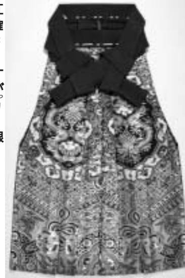
(写真右)英国船マリナー号退帆交渉で坦庵が身につけたという『蜀江錦の小袴』 国文祭開催中のみ限定公開します。

今年の主役・江川坦庵の企画展 「名代官」、「幕末の先覚者」、「世直し大明神」などで知られる、江川太郎左衛門英龍(坦庵)。 伊豆の国市では、今年秋に開催される『第二十四回国民文化祭・しずおか2009 in インターマ』として、江川坦庵をメ 文化祭歴史部門の関連企画展として、『坦庵〜江川太郎左衛門英龍の実像〜』展を約一年間にわたり開催中です。 この企画展では、『絹本淡彩江川坦庵自画像』や『富士山画賛』など、いつもは写真