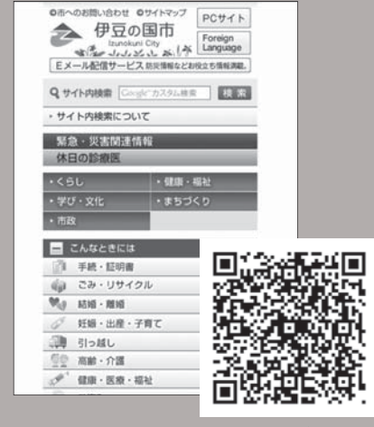
▲ スマートフォン用ページ