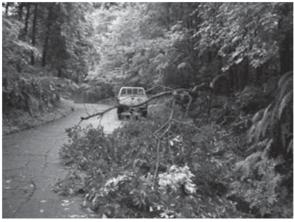
倒木によりふさがれた道路

けではなく、場合によっては歩行者や通行車両の事故につながる恐れがあります。事故を未然に防ぐためにも、私有樹木の適正な管理をお願いします。