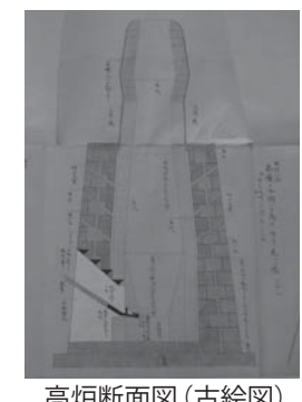
高炉断面図(古絵図)

九州・山口の近代化産業遺産群は、その名の通り、主に九州、山口地区の資産で構成されています。その中で、釜石市の『橋野高炉跡』と伊豆の国市の『葦山反射炉』だけが、九州・山口地区以外から選ばれています。どちらの資産も、九州・山口の近代化産業遺産群のキーワードである『製鉄』『炭鉱』『造船』のうち『製鉄』という分野に該当する資産です。 葦山は『反射炉』、釜石は『高炉』。では、反射炉と高炉の違いはなんでしょうか。 反射炉は『銑鉄』を溶かし、大砲を作るための溶解炉です。一方の高炉は『鉄鉱石』を溶かし、銑鉄を作るための溶