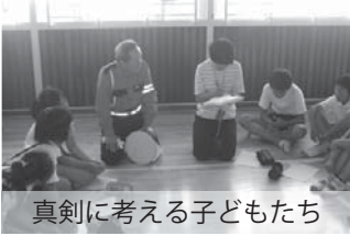
真剣に考える子どもたち

交通安全リーダーと語る会に参加して 市内各小学校で開催された交通安全リーダーと語る会に、交通指導員会も参加しました。通学路で危険な場所はどこか、どのように歩けば良いかを話し合い、真剣に考えている姿はとても頼もしく感じました。 子どもたちから、横断歩道で「地元の車が停まってくれない」という意見がありました。子どもたちは運転手さんを見ている。横断歩道では必ず先に、歩行者を横断させるようしましょう。