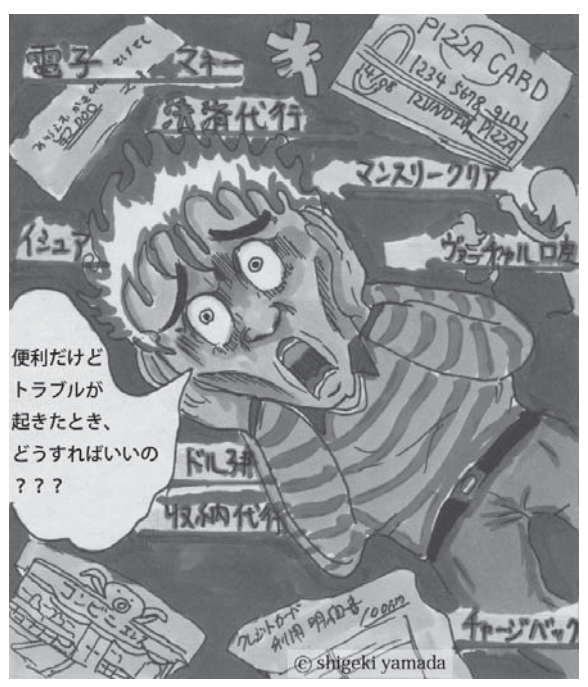
代金の支払いは、その仕組みをよく理解してから！

あなたも狙われるかも！悪質商法にご用心⑤ 近年、特にインターネットや携帯電話を利用した通信販売やサービスの提供などの契約で、その代金の支払い方法が多様化しています。 例えば、翌月一括払いによるクレジットカード決済や電子マネー決済、コンビニ収納代行、また、携帯電話の通話料金などと一緒携帯電話会社から請求されるキャリア課金などがあります。 仮にインターネット詐欺などの被害に遭った場合に、これら決済手段によって適用される法律が異なっていたり、受け皿となる法律が未整備の場合もあります。 これら決済方法はいずれも便利なものですが、いざトラブルが発生した際のことも考えたいので利用したいもの