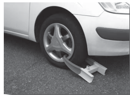
タイヤロックによる差し押さえ(車輪止め)