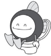
下水道マスコットキャラクター『スイスイ』

下水道には、快適な生活環境を作り、川や海の水質を守るという目的があります。しかし、皆さんに使っていただかなければ、環境の改善にはつながりません。そのため、下水道が使える地域では、接続が義務づけられています。